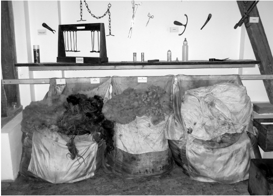
Blick in die Ausstellung

Vor wenigen Monaten wurde diese interessante und informative Einrichtung eröffnet. Für Interessenten des Berufs Schäfer, auch aus genealogischer Sicht, ist hier viel zu