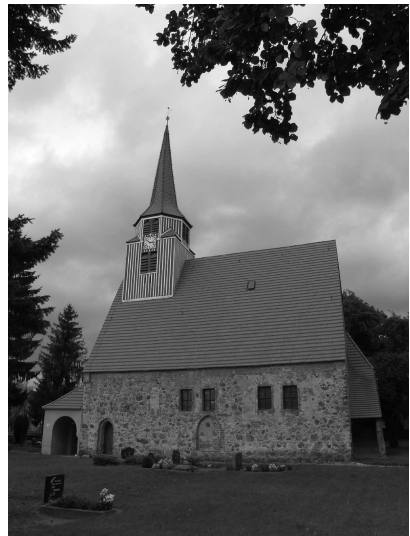
Die Kirche in Demnitz

Wer gern alte Gruselgeschichten mag, sollte die „Eiserne Brücke“ auf der Landstraße nach Steinhöfel besuchen. Die Schautafel mit der dazugehörigen Sage ist in originalem Plattdeutsch und in der jetzigen Aussprache verfasst.